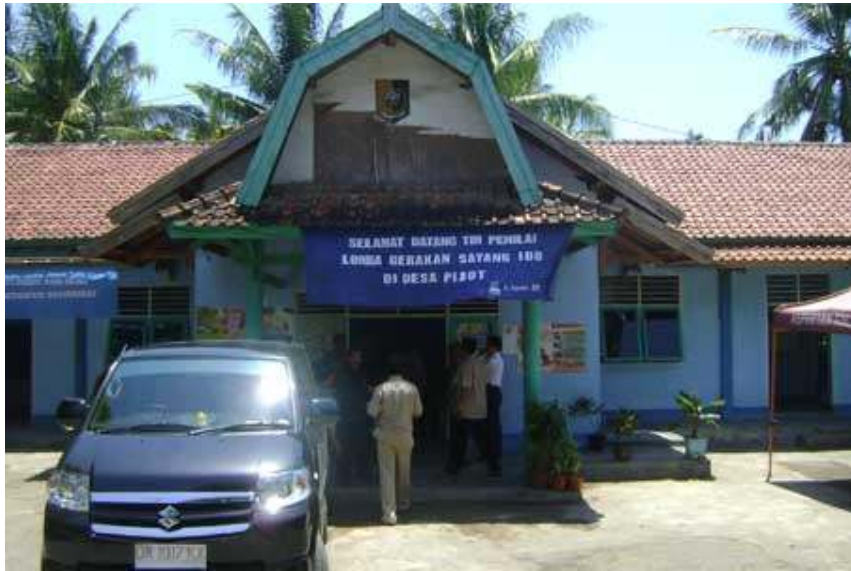
PENILAIAN LOMBA KECAMATAN SAYANG IBU DALAM RANGKA EVALUASI PELAKSANAAN PROGRAM PP DI DESA PIJOT KEC.KERUAK.