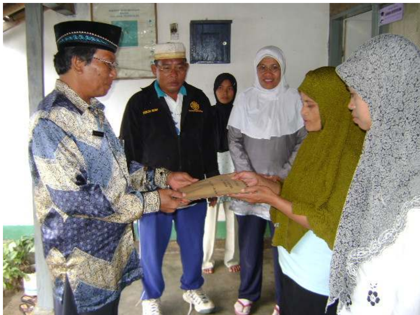
PENYERAHAN DANA KELOMPOK UPPKS DI DESA BEBIDAS OLEH KEPALA BADAN PPKB KAB.LOMBOK TIMUR